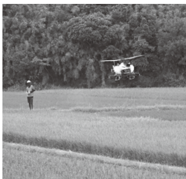
〈無人ヘリによる航空防除〉

南種子町水稻無人ヘリ航空防除連絡協議会事務局(役場総合農政課内) ☎1111 (内線313)