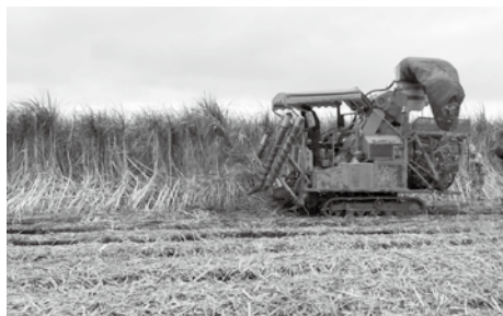
〈さとうきび収穫の様子〉