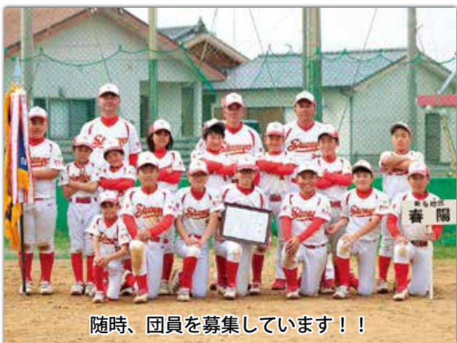
随時、団員を募集しています！！