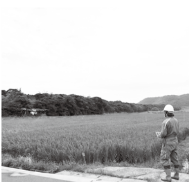
〈ドローンによる航空防除〉