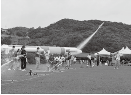
「水ロケット打ち上げ体験」

5月14日(日)に、種子島宇宙センター特別公開を約4年ぶりに開催しました。約1000人の来場者の方に、スペシャルバスツアーやたらく車の展示、LCC&RCC公開といった特別公開ならではの企画にご参加いただきました。