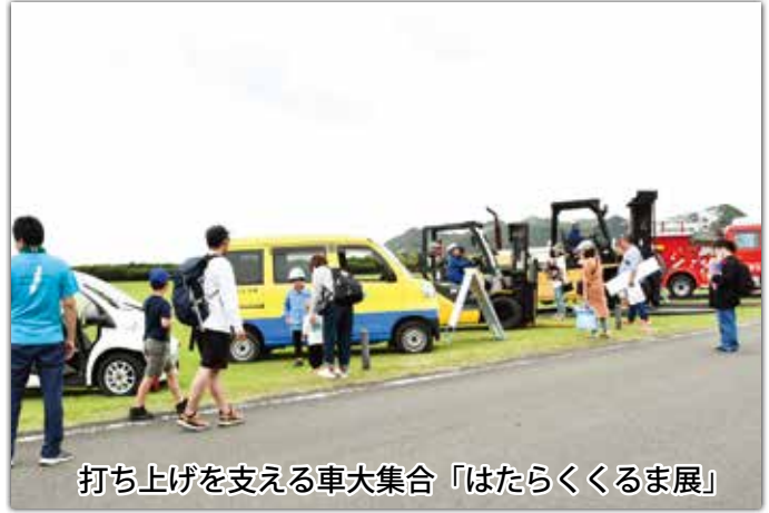
打ち上げを支える車大集合「はたらくるま展」