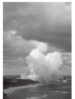
LE-9エンジン燃焼試験の様子