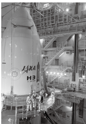
H3ロケット試験機1号機 衛星フェアリング

《Q：フェアリングの中はどのような構造でできているでしょうか？》 ぜひ宇宙科学技術館に来館して答え合わせしてみてください！