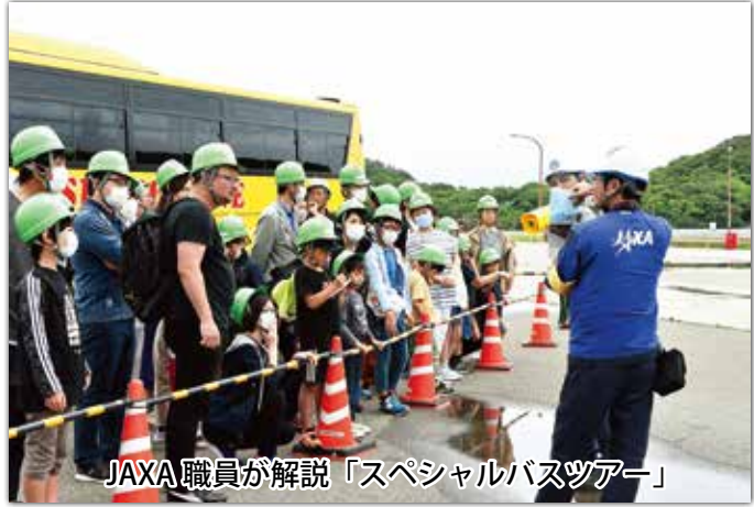
JAXA 職員が解説「スペシャルバスツアー」