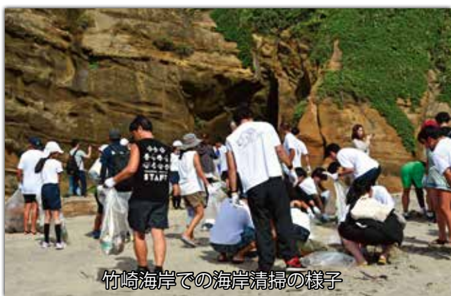
竹崎海岸での海岸清掃の様子

「トリック・オア・トリート!」の掛け声とともに道沿いのお宅を訪問した子どもたちは、お菓子を貰いとても嬉しそうな様子で、地域の方々も、かわいらしい子どもたちの姿に目を細めていました。