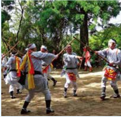
10/6（日） 上中地区（河内神社）

南種子町では、旧暦の9月、春に願立てした豊作が秋になって成就したことを感謝する秋季大祭（願成就祭）が行われます。今年も町内各地で開催され、多くの方々が見守る中、神事とともに各地域で伝承されている踊りが奉納されました。