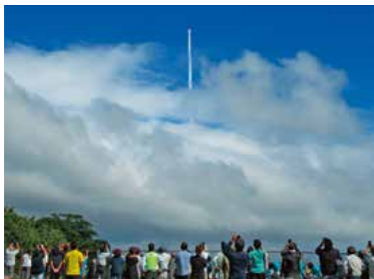
前之峯陸上競技場

今回の打ち上げで、成功率は97・95%となりました。打ち上げ成功おめでとうございます!