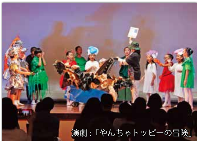
演劇:「やんちゃトッピーの冒険」