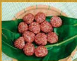
直会で振舞われる赤米の握り飯

全国で古代米とその文化を伝承する地域は、岡山県総社市、長崎県対馬市、そして南種子町荃永の3地域だけです。2市1町では、地域交流を深め「赤米文化」を未来の世代に継承していくことを目的に「赤米伝統文化交流協定」を結び交流が行われています。