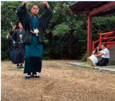
10/5（土） 西海下立石集落（塩釜神社）