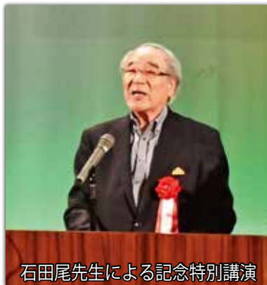
石田尾先生による記念特別講演