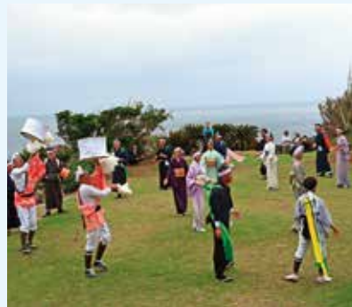
10/20（日） 西之地区（御崎神社）