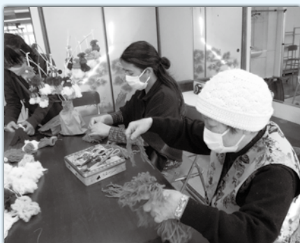
介護者交流会〈クリスマス製作〉