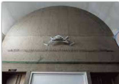
写真④ <GT8215「世阿弥」2017> <ジーティー 8215 ゼアミ 2017> 製作: 篠田 守男

なお、宇宙科学技術館内では、ワイヤーアート『GT8215「世阿弥」2017』(写真④)を宇宙芸術祭終了後も引き続き展示しています。シアターホール入口の上部に展示されていますので、科学館にお越しの際はぜひ解説とともにご覧になってみてください。