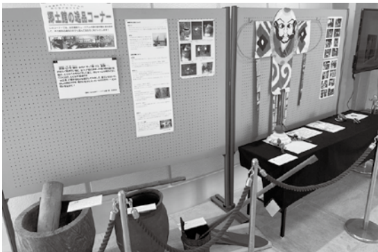
〈お正月にまつわる道具たち〉