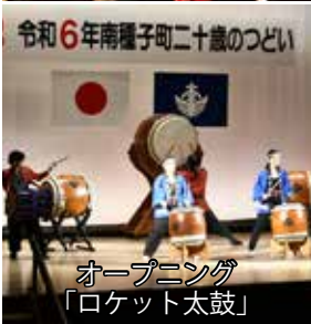
オープニング「ロケット太鼓」