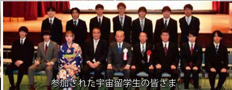
参加された宇宙留学生の皆さま