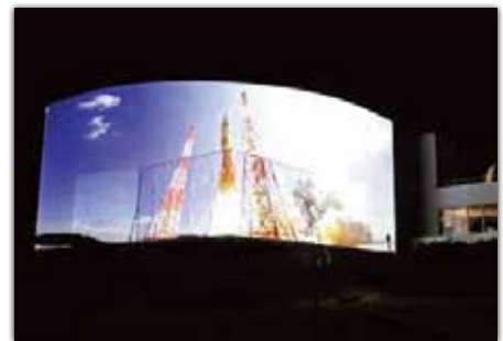
写真① <SINGULARITY> <シンギュラリティ> 製作: Yusuke Murakami