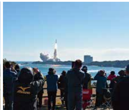
〈恵美之江展望公園〉