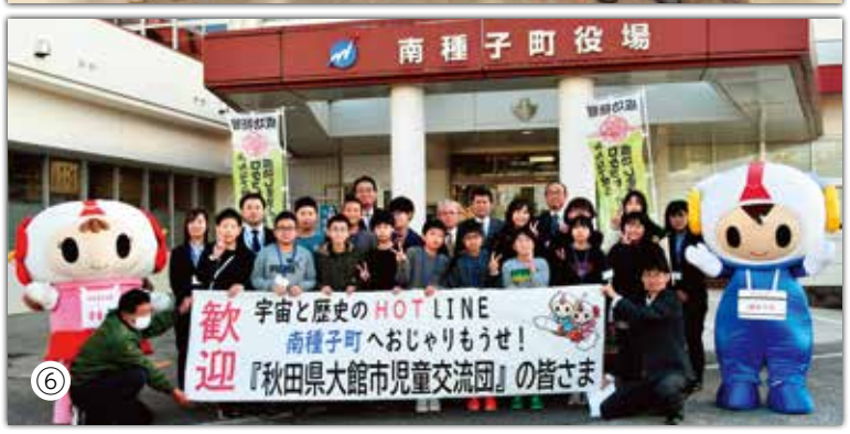
①～③愛知県飛島村児童交流団 ④～⑥秋田県大館市児童交流団