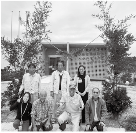
〈今年も素敵な門松ができました〉