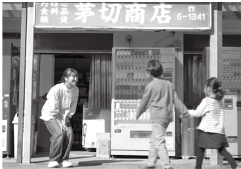
「つないでいく町」 南種子町

このCMは、KKB鹿児島放送で計30回放送される予定で、YouTubeや役場総務課前のテレビでも見る事ができます。ぜひ皆さんご覧ください。