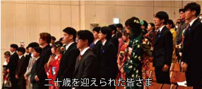
二十歳を迎えられた皆さま

式の最後は、二十歳のつどい実行委員会が作成した「20年のあゆみ」が上映され、参加者は、20年間の思い出を仲間とともに振り返りました。