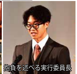
抱負を述べる実行委員長