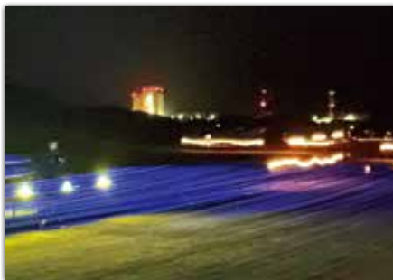
写真② <Afterreal> <アフターリアル> 製作: 千田 泰広

が約20mにも及ぶ作品(写真②)は、夜の大型ロケット発射場を背景に大きな青い光が海のように広がり訪れる人々の目を楽しませました。