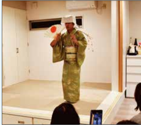
1/14 大宇都集落の蚕舞

小正月の15日に、団子刺し（紅白の餅を木の枝に刺したものを）を持って、女装をした男性が太鼓と歌に合わせて、家の座敷で踊ります。元は養蚕の繁栄を願う行事でしたが、今では農作物の豊作や家の繁栄を願う行事となっています。