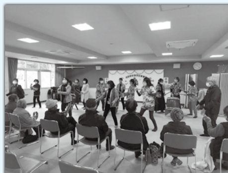
さんだんカフェ〈音楽会〉