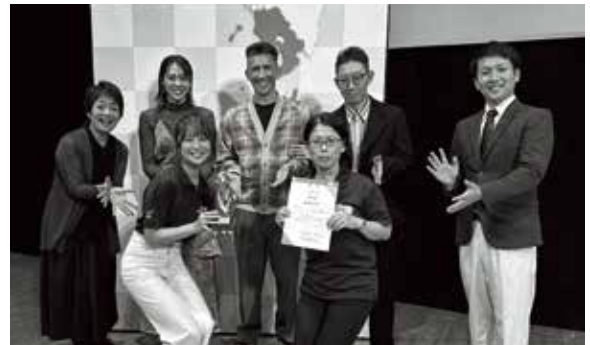
12/6 鹿児島市で行われた 審査会の様子