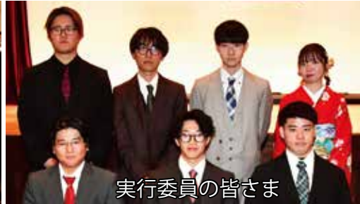
実行委員の皆さま