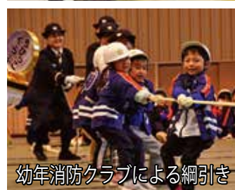
幼年消防クラブによる綱引き