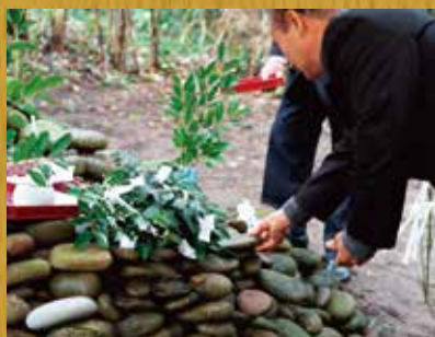
石塚は年々高さを増していきます