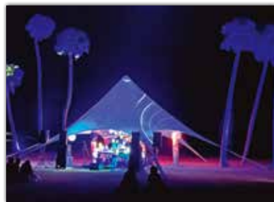
写真③ <Ether 004> <エーテル 004> 演奏: KAH0 Ether × MATRICARIA

幻想的な光の中で老若男女問わず大勢の観客が楽器の生演奏を含めた音楽を鑑賞しました。