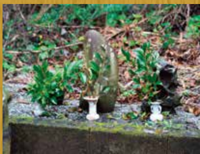
豊漁の伝説があるシャンキイ婆の石（向かって右）

豊漁をもたらしたとされるシャンキイ婆の石や万の供養塔と呼ばれる魚供養の石碑などもあり、見所の多い神社となっています。