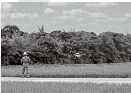
<ドローンによる航空防除>