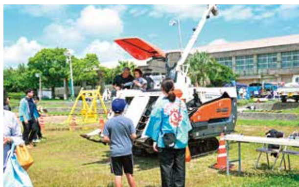
〈はたらく車の試乗体験〉