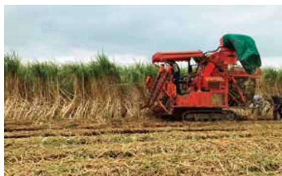
〈さとうきび収穫の様子〉