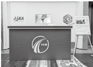
科学館1Fロビーに登場!