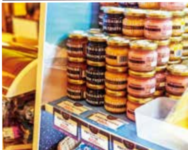
〈特産品も多数取りそろえています〉