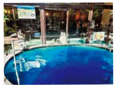
〈南種子町の青い海をイメージした「海風呂」も登場！〉