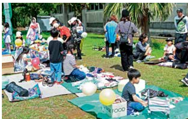
〈こどもフリーマーケット〉