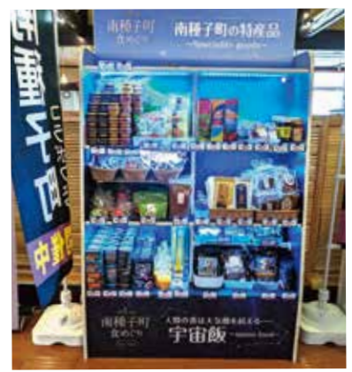
〈フェア実施中の店舗の様子〉