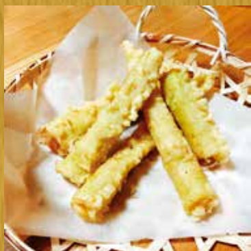
ニガダケの天ぷら

落のモヤ（集会）や直会（なおらい）には欠かせない料理です。 ニガダケのサクサク・シャキシャキとした食感をお楽しみください。