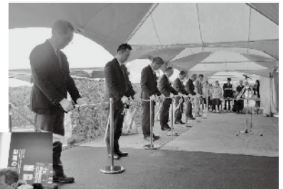
▲広田遺跡ミュージアムオープンのテープカット

応募先：広田遺跡ミュージアム mail: hirotata@hop.ocn.ne.jp