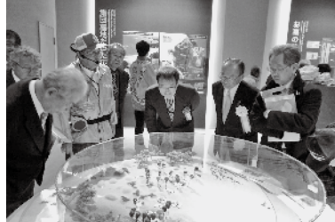
▼来賓を案内する語り部