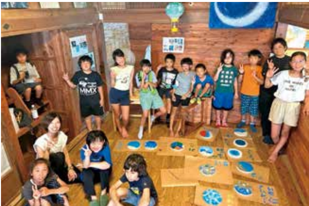
キッズアートプログラム