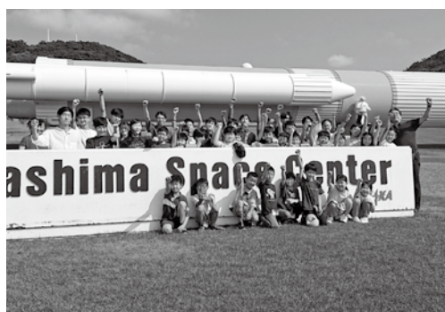
夏季宇宙サイエンスキャンプ参加者と種子島宇宙センターにて

活動開始当初は、夏に入院するなど慌ただしい日々を過ごしましたが、その後は大きな怪我もなく、元気に活動を続けております。引き続き健康に留意しながら、地域の発展に貢献してまいりますので、今後ともよろしくお願いいたします。