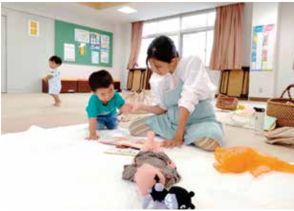
ベビーマッサージ・ベビエヨガ講座