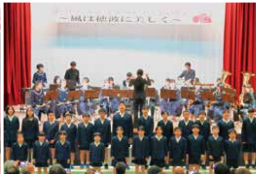
〈ヒカリノミ合奏・合唱の様子〉