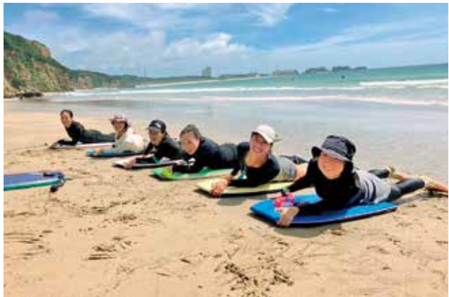
ボディボード講座