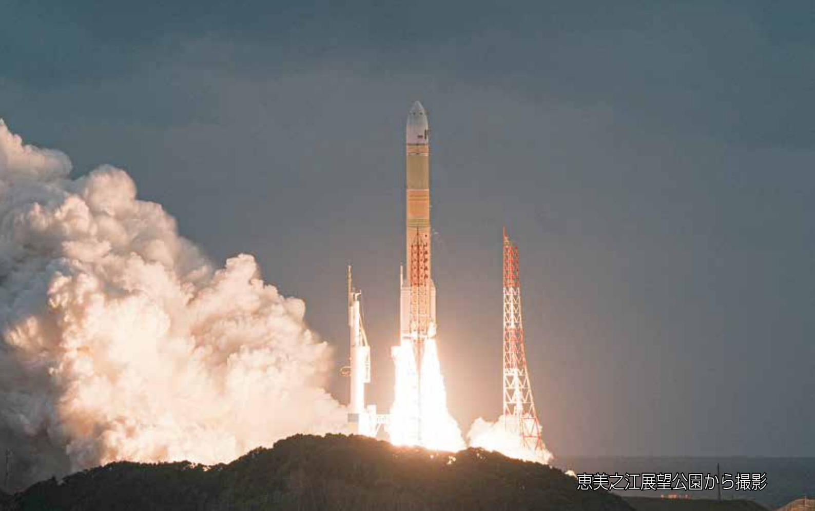
恵美之江展望公園から撮影