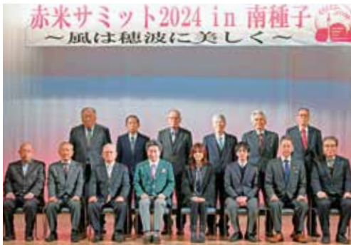
〈赤米サミットメンバー〉

の伝承を考える」をテーマにパネルディスカッションが行われ、3地域で伝承されている赤米文化が貴重であること、文化の継承を行うっていくことの大切さなどについて意見交換がなされました。