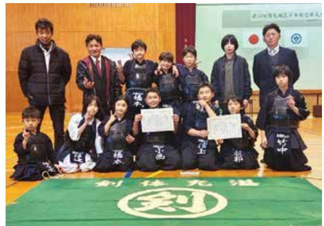
〈熊毛地区少年剣道錬成大会〉