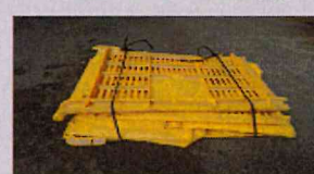
すべてのカゴ類、 切断し、結束