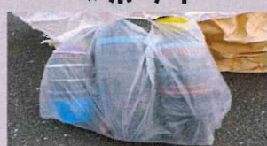
重ねて袋にまとめる