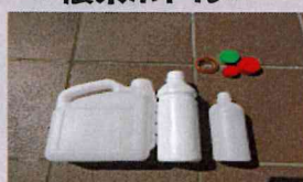
キャップ・ラベルを取り外し 中を洗う