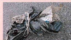
違う種類を重ねる